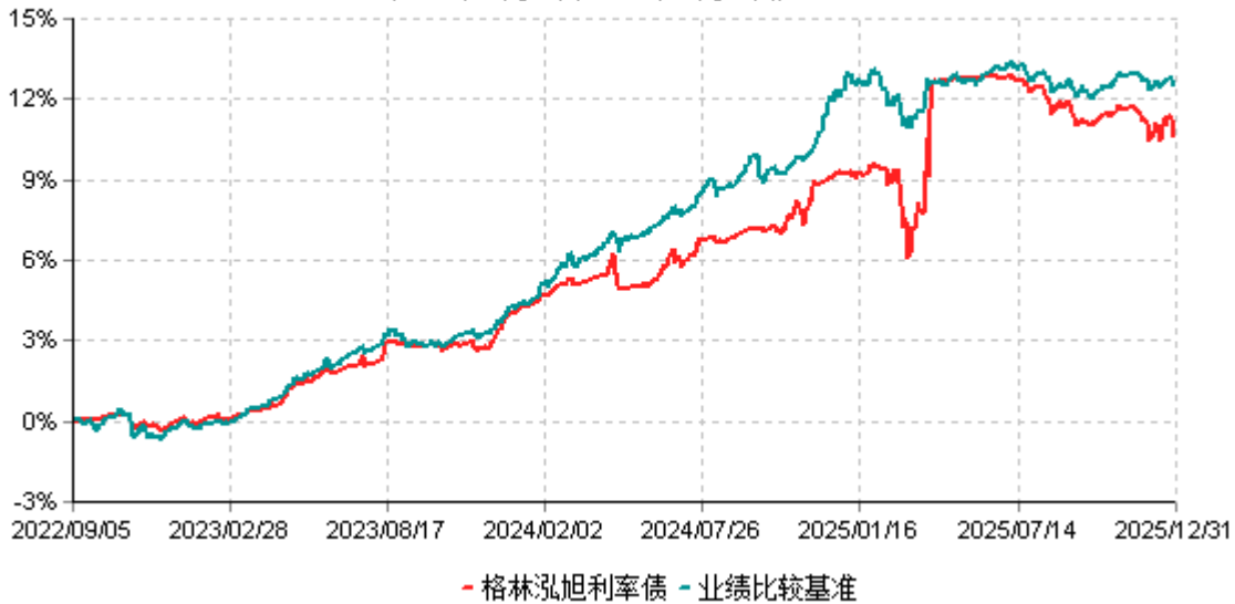
格林泓旭利率债累计净值增长率与业绩比较基准收益率历史走势对比图 (2022年09月05日-2025年12月31日)