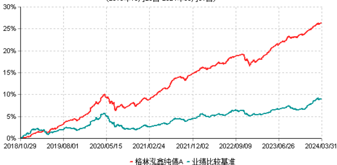
格林泓鑫纯债A累计净值增长率与业绩比较基准收益率历史走势对比图 (2018年10月29日-2024年03月31日)