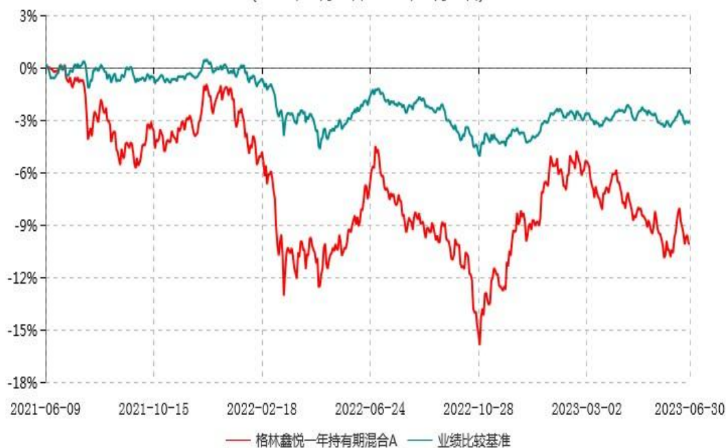
格林鑫悦一年持有期混合A累计净值增长率与业绩比较基准收益率历史走势对比图 (2021年06月09日-2023年06月30日)