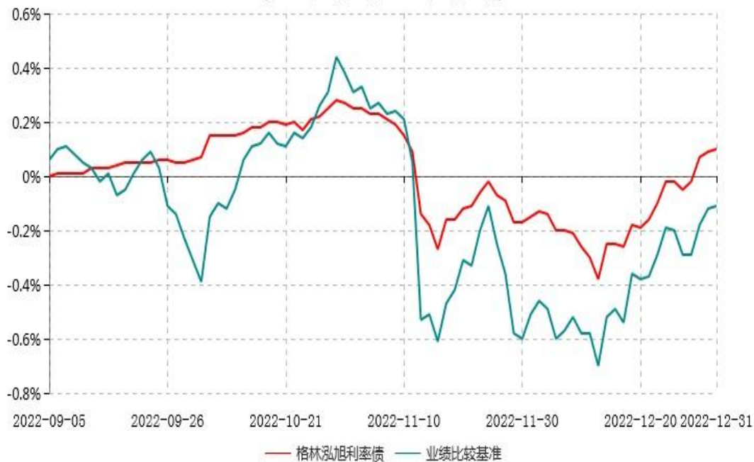
格林泓旭利率债债券型证券投资基金累计净值增长率与业绩比较基准收益率历史走势对比图 (2022年09月05日-2022年12月31日)