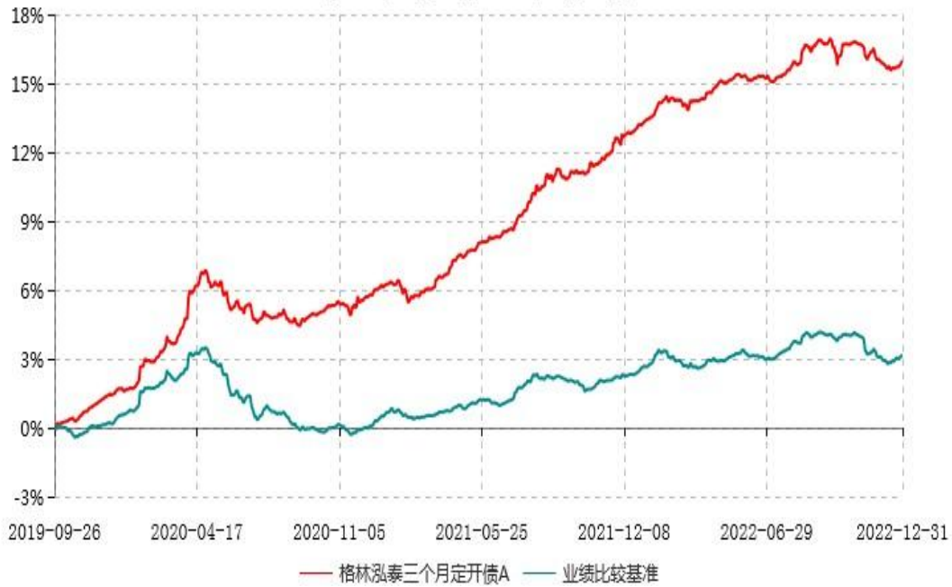
格林泓泰三个月定开债A累计净值增长率与业绩比较基准收益率历史走势对比图 (2019年09月26日-2022年12月31日)