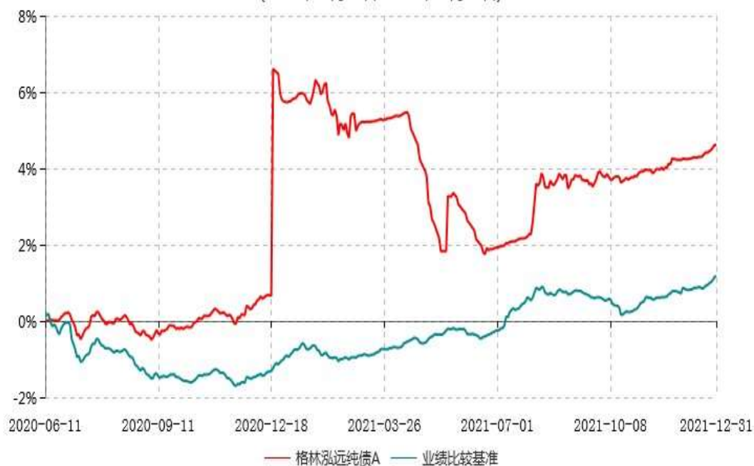
格林泓远纯债A累计净值增长率与业绩比较基准收益率历史走势对比图 (2020年06月11日-2021年12月31日)