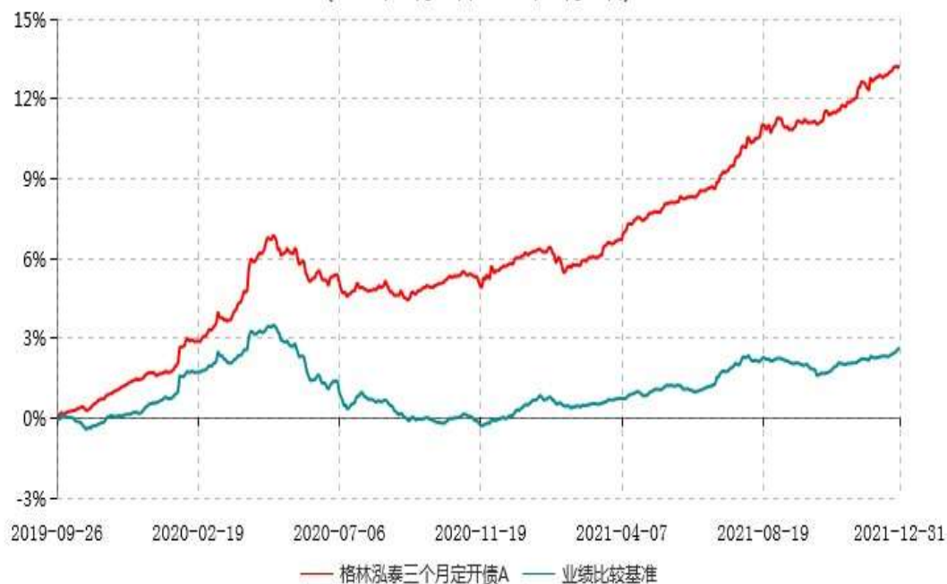
格林泓泰三个月定开债A累计净值增长率与业绩比较基准收益率历史走势对比图 (2019年09月26日-2021年12月31日)