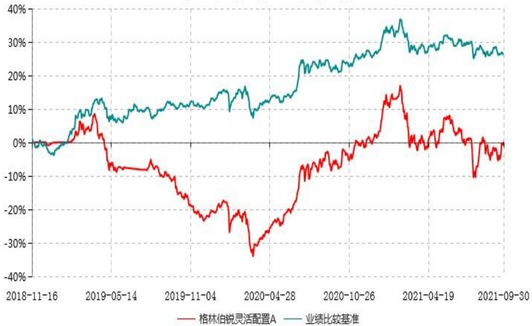
格林伯锐灵活配置A累计净值增长率与业绩比较基准收益率历史走势对比图 (2018年11月16日-2021年9月30日)