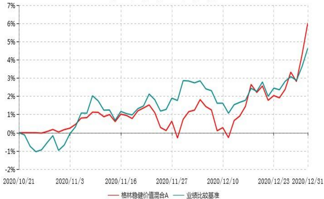
格林稳健价值混合A累计净值增长率与业绩比较基准收益率历史走势对比图 (2020年10月21日-2020年12月31日)