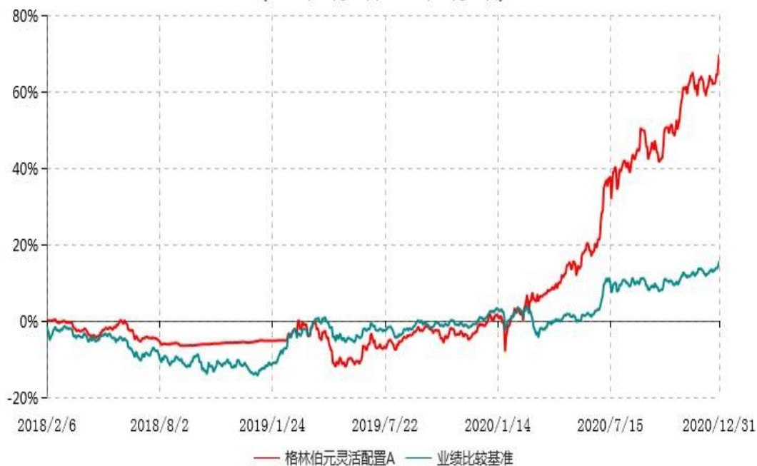
格林伯元灵活配置A累计净值增长率与业绩比较基准收益率历史走势对比图 (2018年02月06日-2020年12月31日)