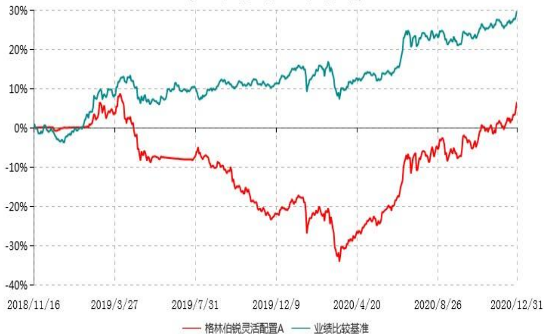
格林伯锐灵活配置A累计净值增长率与业绩比较基准收益率历史走势对比图 (2018年11月16日-2020年12月31日)